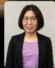
반주 | 현미